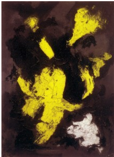
Lucio Fontana, Concetto Spaziale, 1957, huile, technique mixte et paillettes sur toile, 130 x 96 cm

L'artiste italien, à l'honneur d'une grande rétrospective au Musée d'art Moderne de la Ville de Paris, est également exposé dans la capitale, à la galerie Tornabuoni Art, avec notamment la présentation d'une œuvre disparue depuis plus de 30 ans.