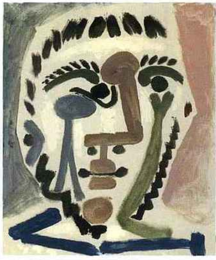
Picasso - Tête d'homme, 1965 Galerie Landau Fine Art