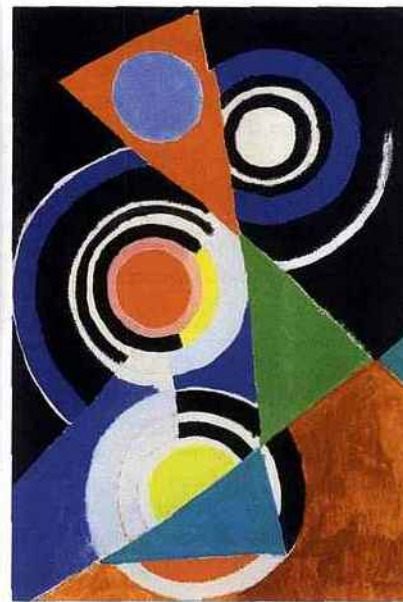
Delaunay - Composition pour Jazz, 1952 Galerie Zlotowski