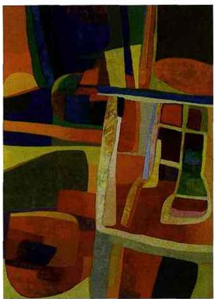
Maurice Estève - Trigourec, 1972 Galerie Applicat-Prazan