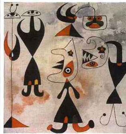
Miró - Femmes, oiseaux, 1944 Galerie Landau Fine Art

Même si la Fiac est dédiée à l'art contemporain, l'art moderne s'invite allègrement dans les allées du Grand Palais. Une valeur sûre de l'art dont l'attractivité ne cesse de grimper chez les plus grands collectionneurs... Sont invités pour cette édition 2015, Picasso, Miro, Chagall, Calder, Fontana, Delaunay, Klein, Dubuffet, ou Man Ray.