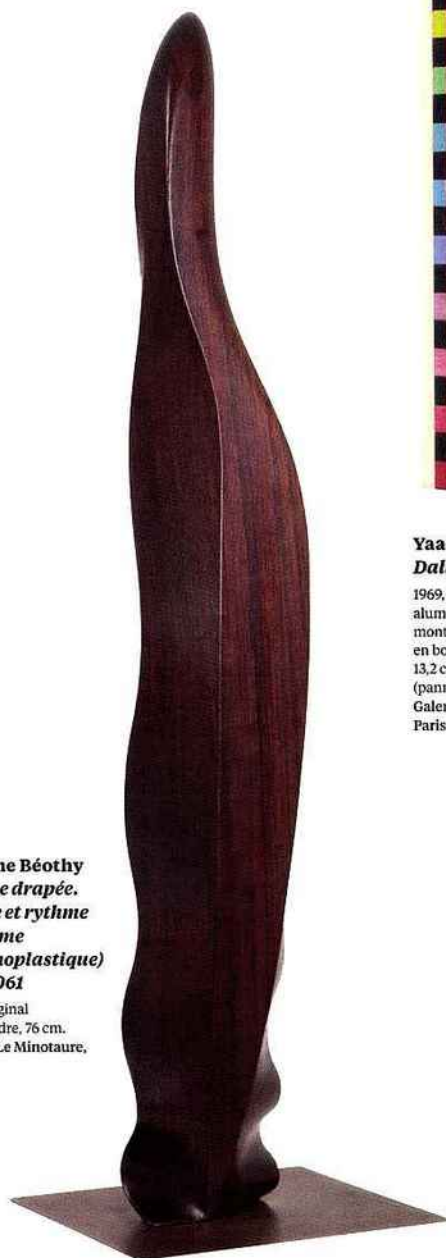
Étienne Béothy Femme drapée. Forme et rythme (Flamme rythmoplastique) Opus 061 1933, original palissandre, 76 cm. Galerie Le Minotaure, Paris.