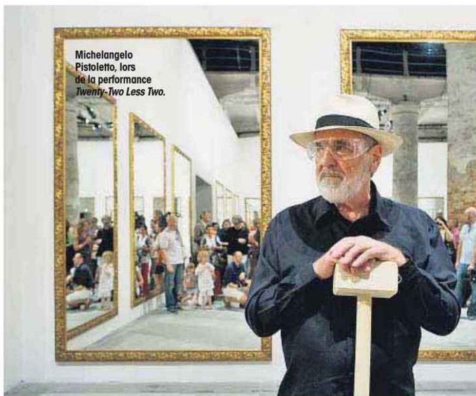
Michelangelo Pistoletto, lors de la performance Twenty-Two Less Two.