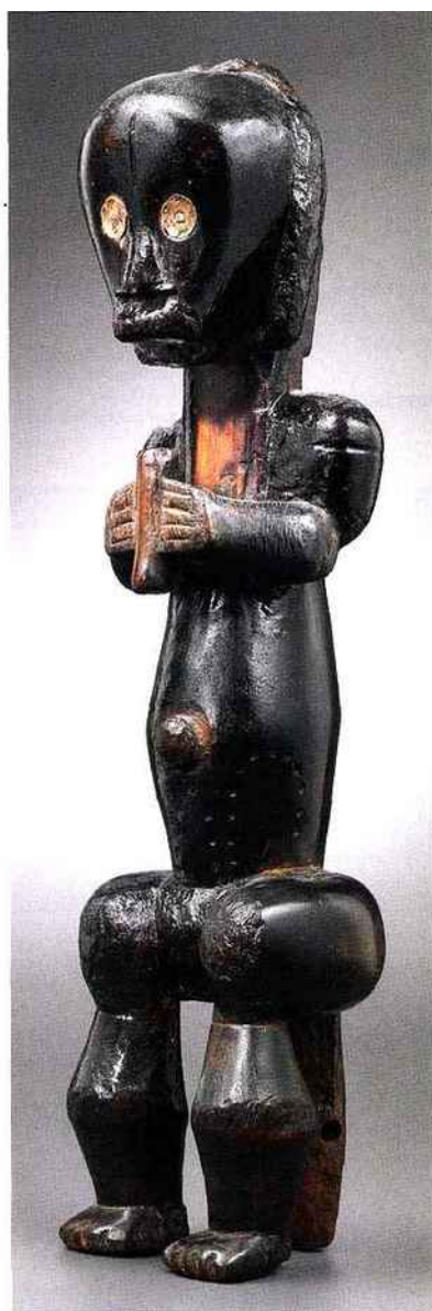
Statue Fang Byeri Gabon, XIX e siècle, bois, métal, h. 42,5 cm. Galene Lucas Ratton, Paris

connaît un certain succès, mais pour certains marchands qui ont depuis intégré la Tefaf à titre permanent, la section apparaît comme un tremplin pour la foire. Parmi les galeries invitées à «Showcase», cette année, trois enseignes françaises mettent le paquet pour le futur. Installée depuis 2006 à Paris, l'Allemande Roswitha Eberwein expose des antiquités classiques, une spécialité phare de la Tefaf, qui compte une dizaine de marchands. Spécialisée dans l'Égypte ancienne, elle a à cœur de montrer un vase canope en faïence bleue du Nouvel Empire, une statuette funéraire d'Ineny, un dignitaire, dans son petit sarcophage ou encore une bandelette de momie de la période ptolémaïque comportant inscription et dessins. Le stand de sculp-