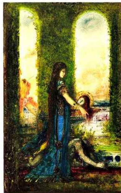
GUSTAVE MOREAU Salomé au jardin 1878, aquarelle, gouache et encre sur papier, 72 x 43 cm. Galerie Gradiva, Paris