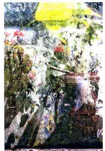
André Pharel, Sans titre , de la série « Réflexions dans un jardin », photographie couleur.

• Exposition collective d'artistes de la galerie, galerie Depardieu, 6, rue du Docteur-Jacques-Gudoni (ex passage Giuffreda), Nice (06), tél. 04 93 96 40 96.