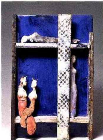
Fausto Melotti, Teatrino (Petit Théâtre) , vers 1950, céramique vernissée et terre cuite peinte, 46 x 30 x 9 cm.

L'univers des sculptures de Fausto Melotti (1901-1986) distille une quintessence indéfinissable de légèreté, de fantaisie et de liberté. Insaisissable, cet artiste natif de Florence pourrait se situer à la croisée des chemins du futurisme, du surréalisme et de l'Arte Povera. Ami de Lucio Fontana, il est aussi très proche du courant métaphysique de Chirico. Il se laisse séduire par la fragilité des matériaux :