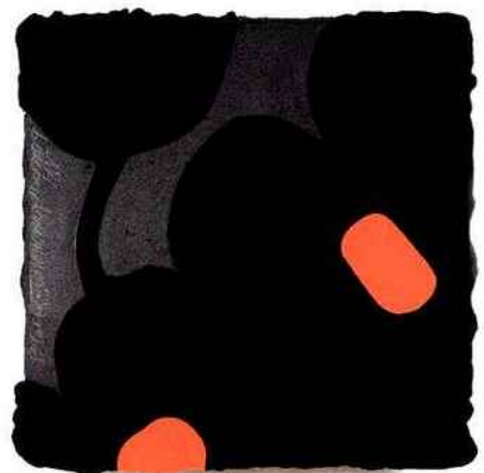
Donald Sultan, Blacks with Orange May 2009 , 2009, émail, mastic, goudron et carreaux de vinyle sur masonite, 61 x 61 cm (PARIS, GALERIE PIÈCE UNIQUE/©DONALD SULTAN).

Donald Sultan, artiste américain né en 1951, est tout particulièrement attaché à la nature morte, dont il bouleverse et métamorphose la perception. Usant d'une technique originale, il inscrit les formes dans un support de vinyle imprégné de goudron, recherchant « une structure lourde détenant une signification fragile », comme le Dead Bird si émouvant. Avec Lantern Flowers et Blacks with Orange , on perçoit une réminiscence des Flowers de Warhol, assombrie par une perception plus dramatique et une énigmatique lecture en négatif. Les dessins sont proposés de 7000 € à 35 000 €, et les tableaux de 21 000 € à 150 000 €. V. DE M.