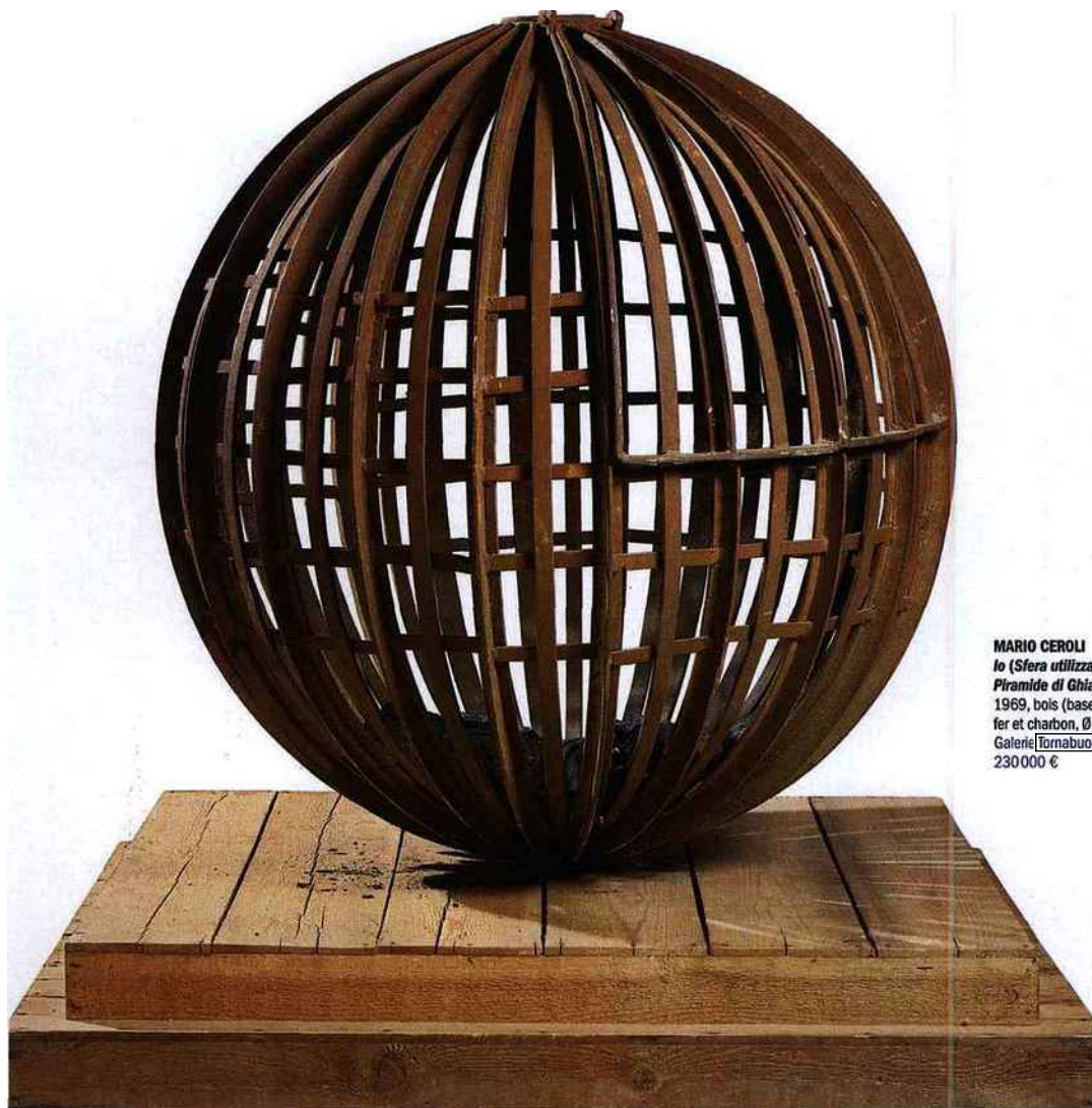
MARIO CEROLI Io (Sfera utilizzata nell'azione Piramide di Ghiaccio) 1969, bois (base), fer et charbon, Ø 92 cm. Galerie Tornabuoni Paris 230 000 €