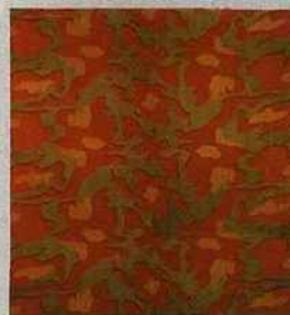
ALIGHIERO BOETTI Mimetico 1967, tissu camouflage sur châssis, 140 x 145 cm. Galerie Tornabuoni, Paris - 900 000 €

Les Mappa , cartes du monde géopolitiques que l'artiste italien a fait broder par des femmes afghanes, comptent aujourd'hui parmi ses œuvres les plus connues et cotées. «Dans les années 1990, une Mappa se vendait 20 000 €. À présent, certaines atteignent 1 à 2 M€», indique Michele Casamonti, dirigeant de la galerie Tornabuoni. L'aspect «décoratif» de ces œuvres, pourtant conceptuelles (le résultat esthétique n'était pas la préoccupation de l'artiste), a élargi le cercle des collectionneurs de Boetti. Et fait grimper sa cote. Mais les amateurs d'arte povera se rappellent surtout que, des années 1960 jusqu'en 1972, Boetti fut une des figures clés du mouvement. Les œuvres de cette période sont recherchées, comme les Dama , sculptures en bois réalisées à partir de jeux de dames, les monochromes réalisés à la peinture industrielle sur métal ou encore les Mimetico (ill. ci-dessous), toiles militaires de camouflage montées sur châssis, dont un exemplaire de 1967, issu de la collection Durand-Dessert, avait été adjugé 370 400 € en 2005 à Paris chez Sotheby's.