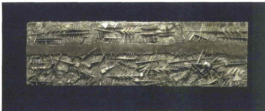
GALLERIA TORNABUONI ARTE , Parigi. La battaglia , studio del 1995 in fiberglass con polvere di grafite e bronzo patinato, 34x120x5 cm. Proposta a 160 mila euro