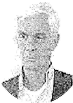
Il pittore Enrico Castellani nel tondo e a fianco un'immagine di una sua opera. L'artista è considerato uno dei più quotati dell'arte europea del '900