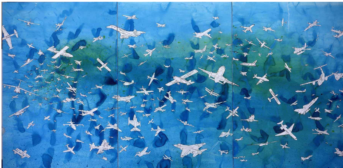
Aerei (Avions), 1989, encre et aquarelle sur papier photographique marouflé, 150x300cm en 3 panneaux de 150x100cm chacun