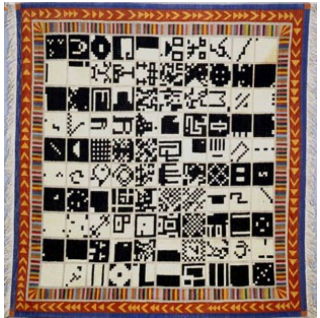
Alternant de 1 à 100 et vice-versa, 1993 Kilim coton et laine 284x288 cm.

Au début des années 70, il scinde son nom en deux, geste qui participe de sa réflexion sur sa propre identité et des multiples personnalités contenues dans l'individu.