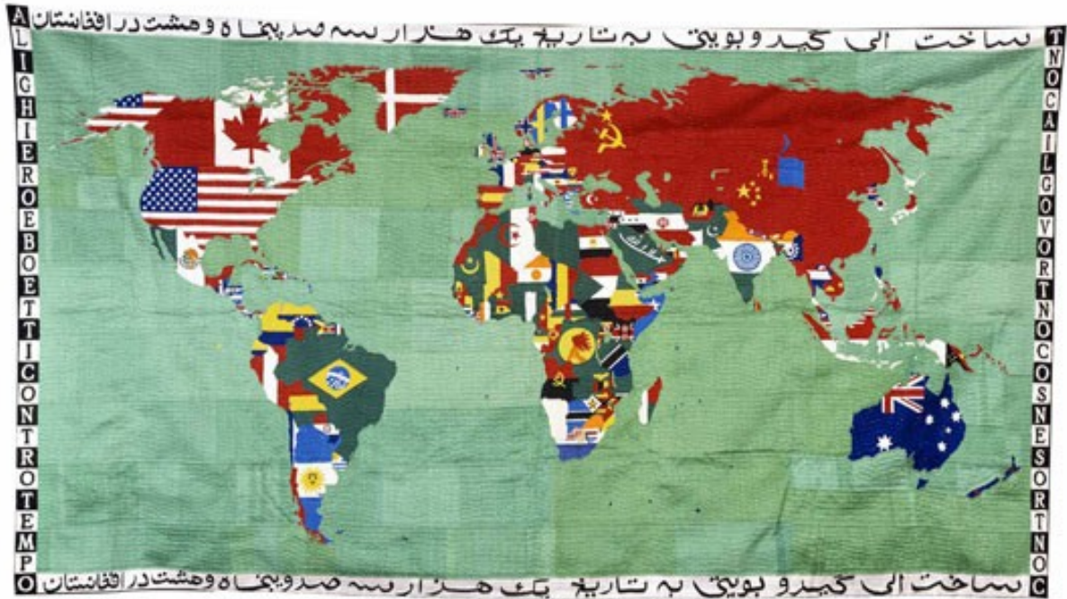
Mappa (Planisphère), 1988 Broderie sur tissu, 120x225 cm.

Les planisphères que Boetti réalisera à partir de 1971 et jusqu'à la fin de sa vie, sont une description géopolitique du monde, où nations et drapeaux sont modifiés selon le cours des événements politiques. La succession temporelle des cartes est donc la narration de l'ordre et du désordre du monde.