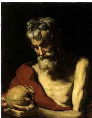
José de Ribera (1591-1652) dit il Spagnoletto [« l'Espagnolet »], Saint Jérôme , 1643, huile sur toile, 78 x 65 cm (musée des beaux-arts de Lille).

moins étroitement associée à la méditation, à la présence du divin, au sentiment de la foi, comme autant d'expressions singulières d'une vision difficilement représentable. Dans le corpus inépuisable d'images offert par les écoles nordique et italienne, l'incarnation de la pensée s'épaule d'accessoires, de symboles, de mises en scène, voire du vêtement d'ermite. La récente acquisition d'un portrait