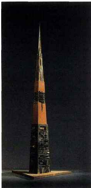
Arnaldo Pomodoro (né en 1926), Lancia di Luce II , bronze, 700 x 120 x 120 cm (Ambassade d'Italie, Paris).

Le sculpteur italien est à l'honneur avec la présentation d'une sculpture de 7 mètres de haut installée dans la cour d'honneur de l'ambassade d'Italie, sise hôtel de La Rochefoucauld-Doudeauville. Cette œuvre prestigieuse est le résultat d'une commande pour commémorer le 150 e anniversaire de l'unité d'Italie. Arnaldo Pomodoro pense sa sculpture en fonction de l'espace et d'un environnement urbain qui combine la lumière et les phénomènes de réflexion. Cela explique la monumentalité tangible d'une œuvre qui essaime dans de nombreuses villes en Allemagne, aux États-Unis, à Moscou, Tokyo, Caracas, Honolulu, Canberra, à Rome et Milan où il s'est installé au début des années 1950. L'exposition se déploie simultanément à l'ambassade et à la galerie