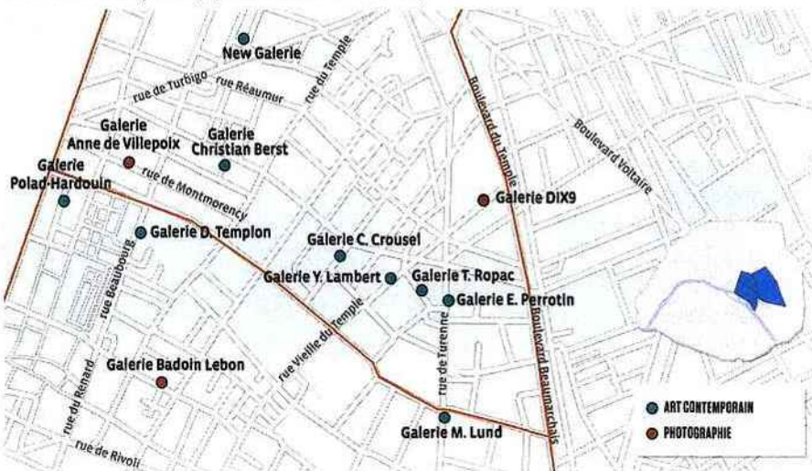
Le Marais contemporain (3 e , 4 e et 11 e arrondissements)

Galerie Drouart 16, rue de la Grange-Batelière SALLE DES VENTES Hôtel Drouot 9, rue Drouot