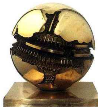
Arnaldo Pomodoro, Sfera , 1990, bronze, Ø 50 cm (TORNABUONI ART, PARIS).

Pomodoro est surtout connu pour ses sphères de bronze brillantes dont la fracture tellurique et l'éclatement laissent apparaître un univers abstrait construit. Ses œuvres monumentales installées dans des lieux publics à travers le monde, comme au siège de l'Unesco à Paris ou à l'Exposition universelle de Shanghai, où il présentait une pièce de dix mètres de haut pour le Pavillon italien, lui ont donné une dimension internationale. Arnaldo Pomodoro ouvre même en 1999 sa Fondation à Milan, dans une ancienne fabrique de turbines hydrauliques. Allant au-delà de cette image d'artiste « officiel », la galerie Tornabuoni