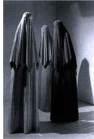
Mario Ceroli. « Les talibanes ». 2002. Bois peint. Environ : 220 x 70 x 60 cm chacune

Tout l'œuvre de Ceroli tend vers la conquête de la troisième dimension, de « toutes les dimensions de la 3 e dimension », pourrait-on dire: reliefs, ronde bosse, portes ouvrant sur d'au-